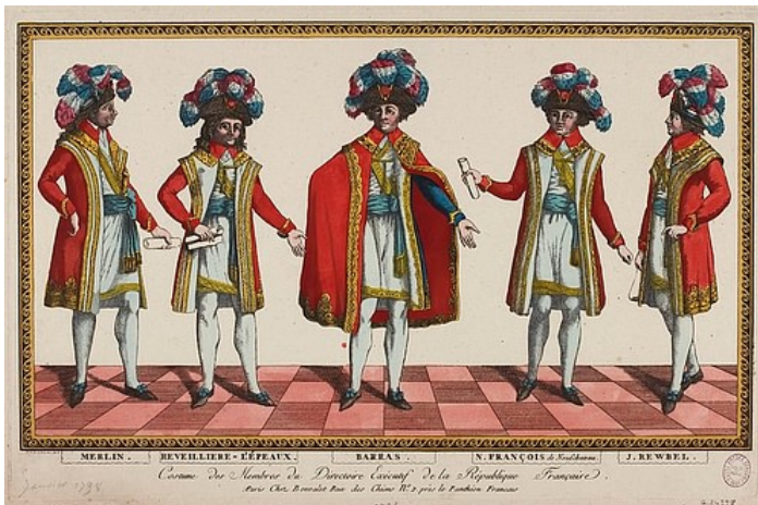
Members of the French Directory - Unknown (Public Domain)

Il Direttorio francese (francese: le Directoire ), è stato il governo della Francia dal 2 novembre 1795 al 9 novembre 1799, il periodo che ha attraversato gli ultimi quattro anni della Rivoluzione francese (1789-1799). Nonostante i successi militari il Direttorio era impopolare e dovette affrontare crisi economiche e disordini sociali. Alla fine fu rovesciato dal Colpo di Stato del 18 brumaio .