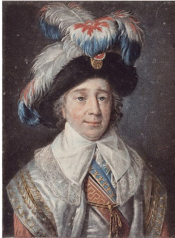
Paul Barras - Pierre-Michel Alix (Public Domain)

Il governo aveva un organismo legislativo a struttura bicamerale, il Corps Législatif , che consisteva in una camera alta, il Consiglio degli Anziani , e in una camera bassa, il Consiglio dei Cinquecento . Il Consiglio dei Cinquecento era composto da deputati di età pari o superiore ai 30 anni che avevano il compito di proporre le leggi; il Consiglio degli Anziani, composto da 250 deputati di età superiore ai 40 anni, aveva il potere di accettare o porre il veto alle leggi. Il potere esecutivo era affidato a cinque Direttori , uomini di almeno 40 anni che avevano precedentemente ricoperto un incarico ministeriale o legislativo. I Direttori erano scelti dal Consiglio degli Anziani, da un elenco fornito loro dal Consiglio dei Cinquecento; ogni anno, i Direttori tiravano a sorte chi sarebbe andato in pensione e un nuovo uomo sarebbe stato scelto per sostituirlo. Il Direttorio era organizzato in questo modo per garantire la separazione dei poteri.