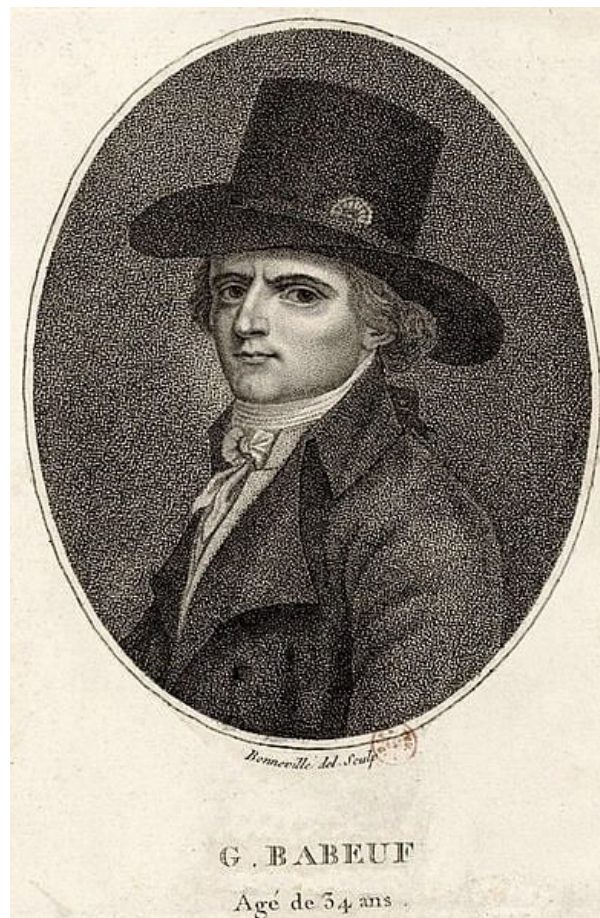
François-Noël (Gracchus) Babeuf

piccola rinascita giacobina disturbò il Direttorio, che ordinò al generale Napoleone Bonaparte di chiudere il Circolo del Pantheon il 27 febbraio 1796.