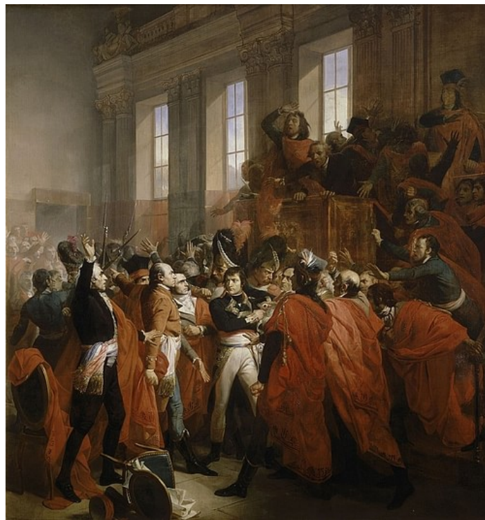
General Bonaparte in the Coup d'état of 18 Brumaire - François Bouchot (Public Domain)

Il generale Bonaparte tornò dall'Egitto nell'ottobre 1799 come uomo popolare. A questo punto, le elezioni del 1799 avevano confermato il controllo neo-giacobino della legislatura; lo stesso fratello di Napoleone, Luciano, era un giacobino convinto e fu eletto presidente del Consiglio dei Cinquecento, sebbene avesse solo 24 anni. Nello stesso anno, Emmanuel-Joseph Sieyès divenne uno dei direttori; Sieyès, che disapprovava la Costituzione dell'Anno III, vide l'opportunità di organizzare un proprio colpo di Stato e creare un nuovo governo. Ottenne il sostegno di figure influenti come Talleyrand, ma sapeva di aver bisogno di un generale popolare per un colpo di Stato. Dopo che la sua prima scelta, il generale Joubert, fu ucciso in battaglia, Sieyès optò per l'immensamente popolare Napoleone Bonaparte.